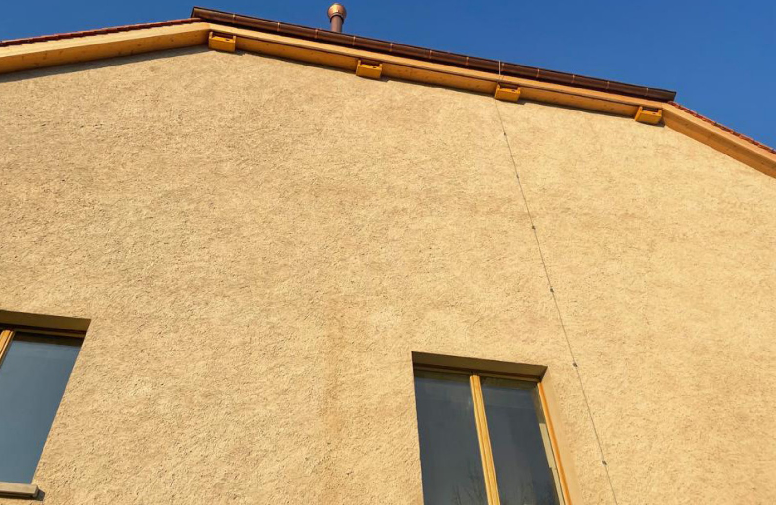
Au-dessus : Les nichoirs à martinets de la Ferme Menut-Pellet, nouveau lieu de la MQ Concorde, 2022.