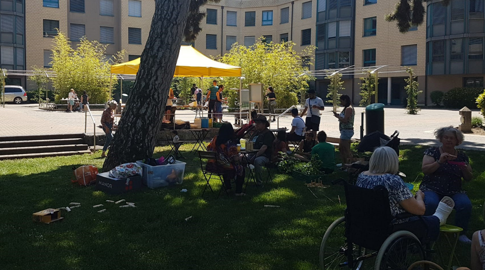
Au-dessus: Marché de plantons, 2022