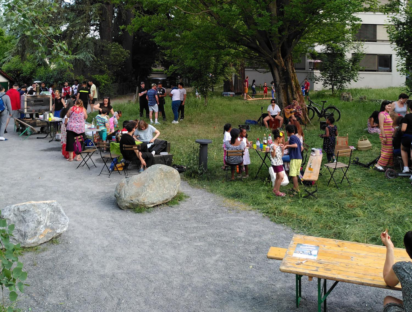
Au-dessus : Fête des voisin.e.x.s, 2022.